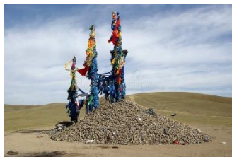
OVO - Mongolië